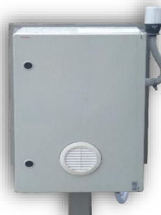
Szafka z układem sterowania